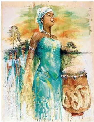
Titelbild Weltgebetstag 2018

Jedes Jahr werden am ersten Freitag im März auf der Welt die gleichen Gebete und Lieder eines Landes gesungen. Es ist wie eine Gebetskette um die Welt. Auch in Bad Doberan wird dazu wieder eingeladen. Der Weltgebetstag wird in diesem Jahr von Frauen aus Surinam vorbereitet. Es ist das kleinste Land Südamerikas und liegt an der Nordküste. Es leben dort 540 000 Einwohnerinnen und Einwohner aus vier Kontinenten. Der Weltgebetstag 2018 steht unter dem Motto „Gottes Schöpfung ist sehr gut „. Über Konfessions- und Ländergrenzen hinweg engagieren sich christliche Frauen beim Weltgebetstag dafür, dass Frauen und Mädchen überall auf der Welt in Frieden, Gerechtigkeit und Würde leben können. So entstand in den letzten 130 Jahren die größte Basisbewegung christlicher Frauen weltweit.